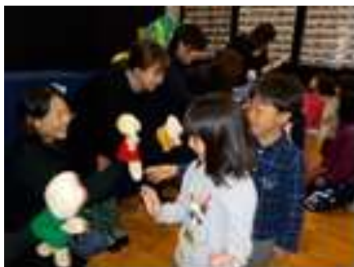
人形劇 「さんびきのこぶた」

3月最後の読み聞かせの日には、部員・保護者有志・幼稚園職員が協力して人形劇を開催します。