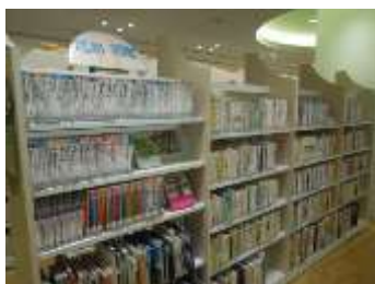
ヤングアダルトコーナー