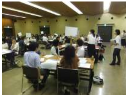
（回答を出し合う様子）