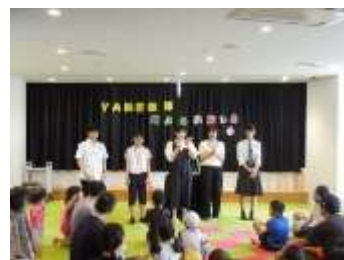
ボランティアによるおはなし会