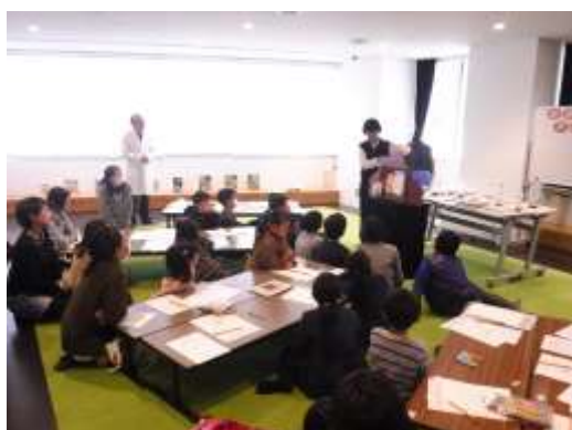
科学マジックでアニメーション