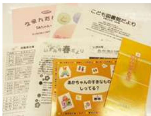
「ブックスタート・パック」