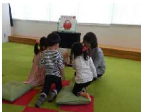
笑顔がひろがる♪アニメーション