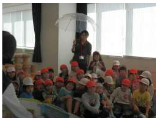
学校見学でアニメーション