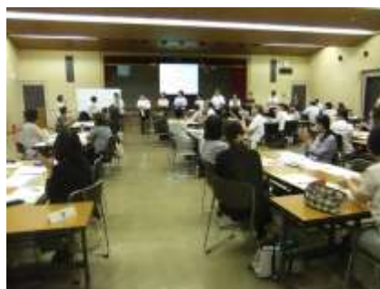
（タイトルを発表する様子）