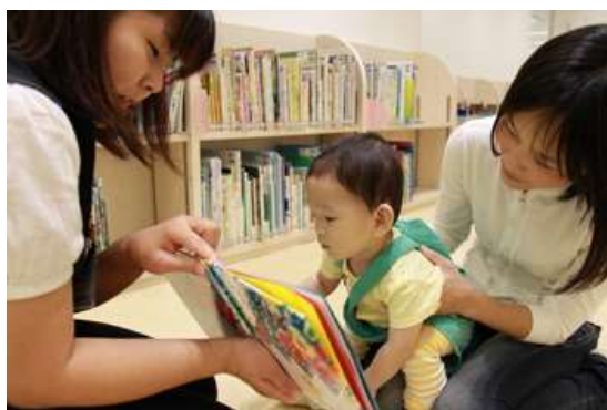
読み聞かせ体験の様子

市内在住の4カ月児とその保護者を対象に通知し、指定の受け取り場所へお送りした引換券を持ってお越しいただくと、図書館スタッフやボランティアが、赤ちゃんにとっての絵本との出会いの大切さや楽しさなどを保護者の皆さんに伝え、どんなふうに読んであげたらいいのか実際に赤ちゃんとその保護者の皆さんに読み聞かせを体験していただき、「ブックスタート・パック」（絵本3冊、イラストアドバイス集、絵本のリスト等）をお渡ししています。