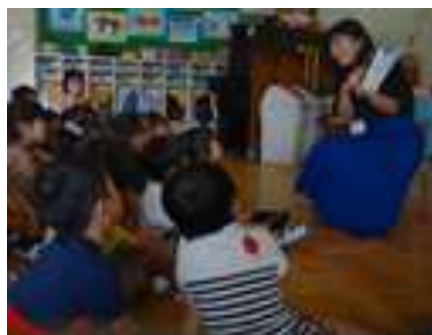
絵本の読み聞かせ(5歳児)

年齢や発達、季節など幼児の興味に合わせた絵本や紙芝居を選んだり、絵本の内容が幼児に伝わりやすいように工夫したりして下さるおかげで、幼児たちは、毎月、わくわくしながら楽しみにしています。