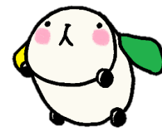
こいずみ 移動図書館キャラクター

移動図書館の書庫には、120,000冊以上の本が所蔵されています。そこから、約3,000冊を選びいずみ号に載せています。