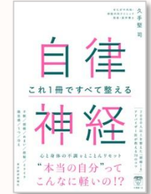
自律神経 久手堅 司/著

大地震、カルト宗教、ブラック企業、生成AIなど、身のまわりの問題と深く関わっている日本国憲法。法律家である著者が携わった事例や様々な社会問題を通して、実は「役に立つ」憲法という視点から日本国憲法を学ぶ入門書。