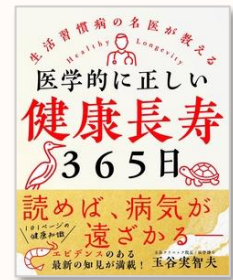
医学的に正しい健康長寿365日 玉谷 実智夫/著