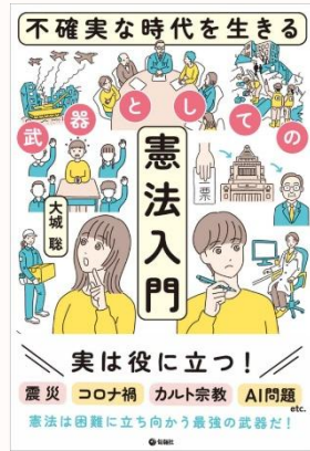
不確実な時代を生きる 武器としての憲法入門 大城 聡/著

疲れやすい、風邪をひきやすい、集中力が続かない…。ムリがきかない体で、どのように日々の仕事と向き合っていけばいいのか？体が弱くても結果を出せるよう、体力・気力を削られない「働き方」と「休み方」を紹介する。