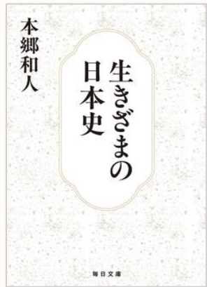
生きざまの日本史 本郷 和人/著

歴史上に名を残した偉人たちも、当時を生きただけの人間。彼らは何を考え、感じ、どう行動したのか。完全無欠の人間を描いた「偉人伝」ではない、人間くさく親しみのわく「人物伝」を紹介。『サンデー毎日』連載を文庫化。