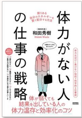
体力がない人の仕事の戦略 和田 秀樹/著

疲れやすい、風邪をひきやすい、集中力が続かない…。ムリがきかない体で、どのように日々の仕事と向き合っていけばいいのか？体が弱くても結果を出せるよう、体力・気力を削られない「働き方」と「休み方」を紹介する。