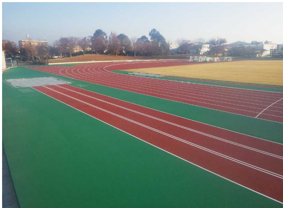
メイン側トラック