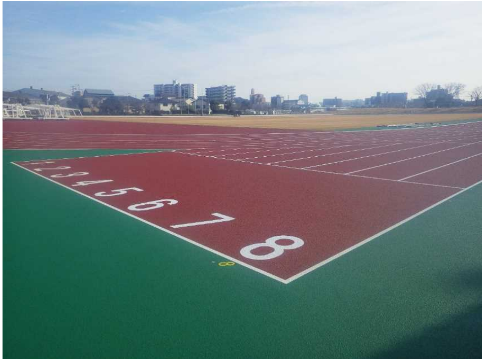
メイン側スタートライン