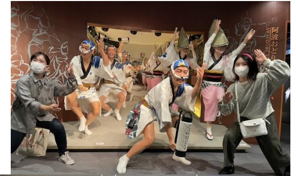
令和4年度参加者の様子