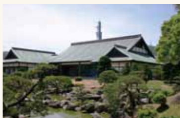
徳島市立徳島城博物館

は、かつての徳島城の堅城ぶりを雄弁に物語ってくれます。石垣は時代によって異なる技法が採られ、中でも本丸東側に残る自然石で積み上げた「野面積み」は、蜂須賀氏の入国当時に伝わるものとして「見の価値あり」といえるでしょう。 通勤・通学の途中に、お花見のシーズンに、阿波踊りの帰路に、あるいは気ままな散歩の道々に、もし徳島中央公園を通る機会があれば、少しだけ注意してあたりを探してみてください。姿を消して100年以上を経て、なお、きつと徳島城の面影を感じ取ることが出来ます。