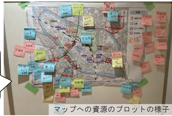
マップへの資源のプロットの様子