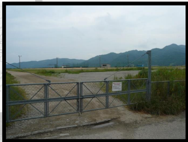
敷地進入場所（敷地北西側）