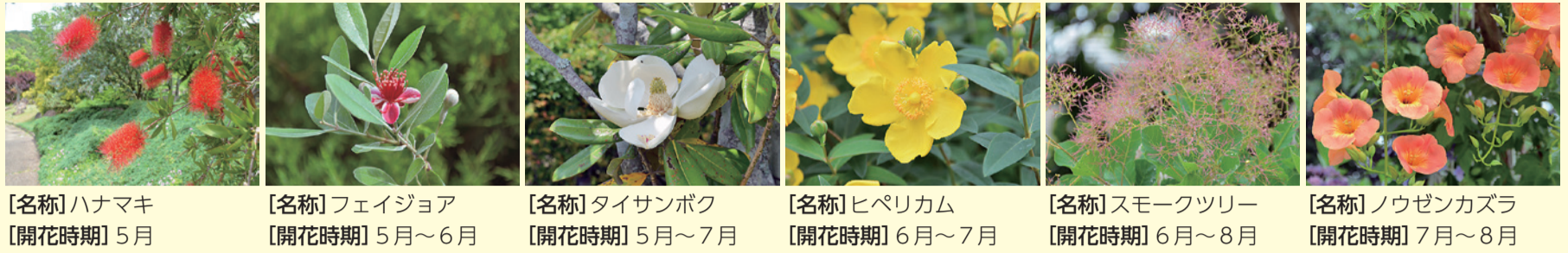
【名称】ハナマキ 【開花時期】5月 【名称】フェイジョア 【開花時期】5月～6月 【名称】タイサンボク 【開花時期】5月～7月 【名称】ヒペリカム 【開花時期】6月～7月 【名称】スモークツリー 【開花時期】6月～8月 【名称】ノウゼンカズラ 【開花時期】7月～8月