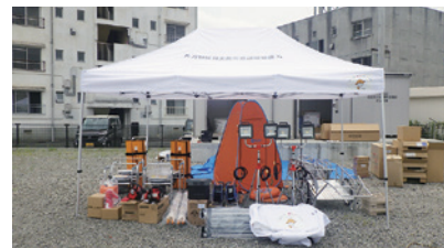
▲救助工具などの防災資器材