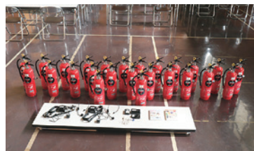
▲女性防火クラブ活動資器材(水消火器・防災教育DVD・デジタルカメラ・拡声器)