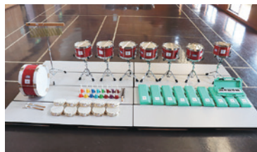
▲幼年消防クラブ活動資器材(楽器一式)

徳島市ではこの事業により、令和6年度に、①幼年消防クラブ、女性防火クラブおよび少年消防クラブへの活動資器材②防災用ライトや救助工具などの防災資器材③音響機器、複合機(下写真)を整備しました。