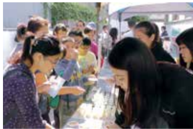
▲特産品を試食する参加者