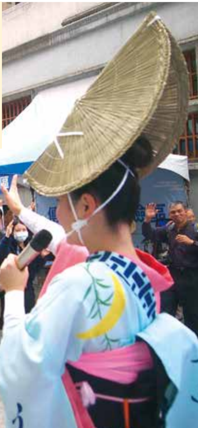
有名連員の指導のもと、阿波おどりを楽しむ参加者たち

徳島市を訪れる外国人観光客を増やすため、台湾の中心都市台北市の新富町文化市場で、本市の観光PRイベントを1月16日(水)~23日(水)に開催しました。観光セミナーや阿波おどり教室、市の特産品を使った試食コーナーなどで、多くの来場者を魅了しました。17日(木)には、花蓮県吉安郷(かれんけんきちあんごう)と友好交流協定を締結しました。