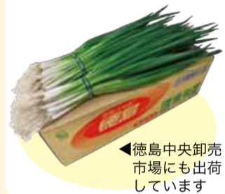
◀徳島中央卸売市場にも出荷しています

渭東ネギは、県内第一号の地域団体商標として平成18年に登録されました。共同出荷により、京阪神市場の厚い信頼を得て、昨年度は75万トンを出荷しました。