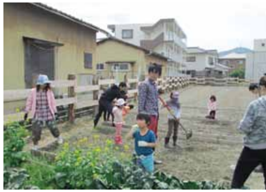
▲「家族で気軽に農業を学ぶ」事業の様子