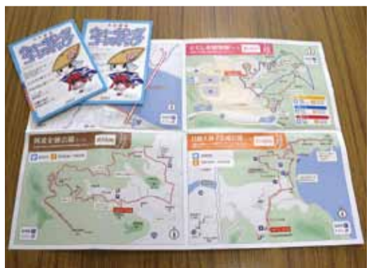
▲ウォーキングコースマップ

徳島市では、生活習慣病を予防するために「ウォーキング推進運動」を通じて、市民の皆さんの健康づくりを支援しています。