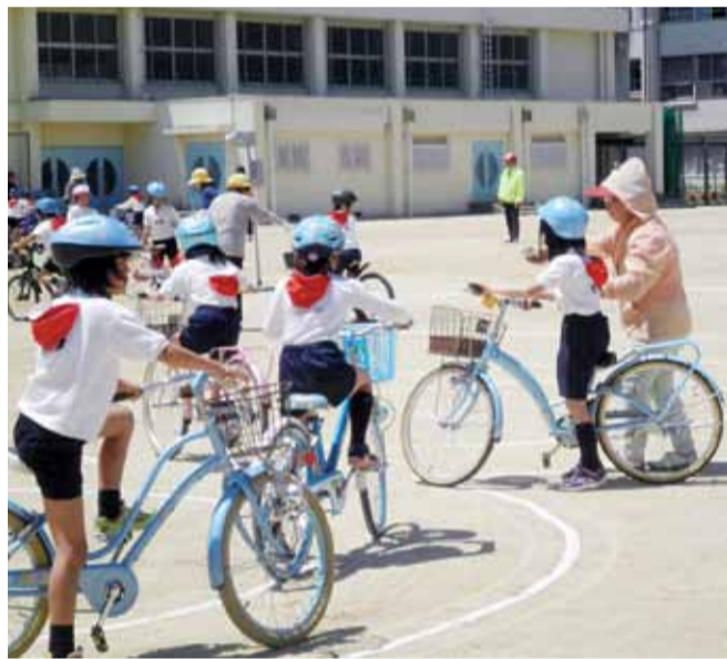
▲自転車の走行指導を行う交通安全教室