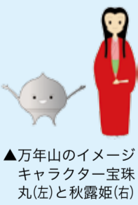
▲万年山のイメージキャラクター宝珠丸(左)と秋露姫(右)

佐古山町にある「徳島藩主蜂須賀家万年山墓所」の見学会を開催します。 国指定の史跡である万年山墓所には、8代以降の徳島藩主(9代藩主を除く)とその一族が埋葬されており、現在徳島市が修復整備を行っています。 見学会では、地元ボランティアガイドの案内で、修復を終えた墓や整備中の墓を徒歩で巡ります。歴代徳島藩主の墓所を巡り、蜂須賀家の歴史の一端に触れてみませんか。 【とき】3月26日(土)13:30~16:00(雨天の場合は4月2日(土)) 【ところ】万年山墓所※集合場所は佐古小学校 【定員】150人(抽選) 【参加費】無料 【申し込み方法】往復はがきに住所、名前、年齢、電話番号、返信宛名を書いて、3月15日(火)(必着)までに、佐古公民館(〒770-0024 佐古四番町7-1 ☎656-1635)へ