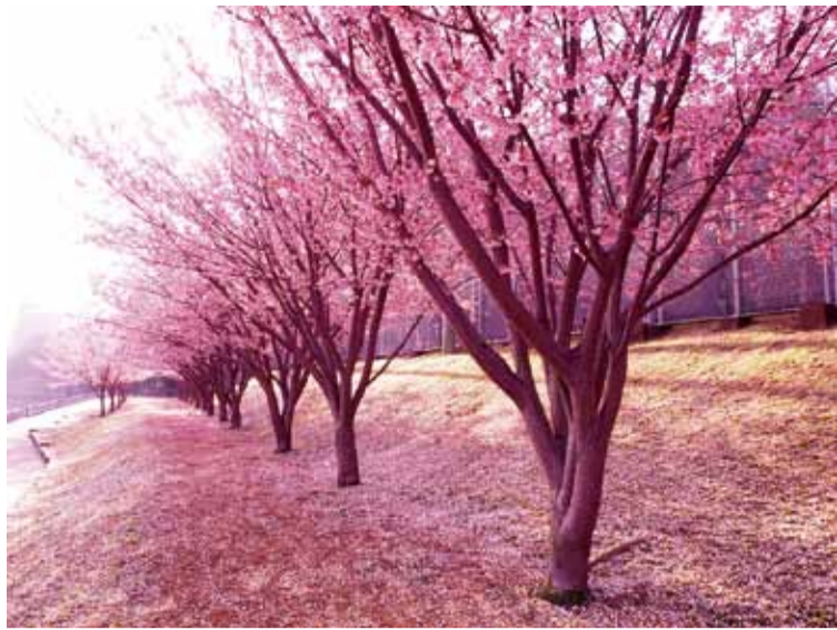
▲昨年度のデジタル部門1位作品「桜の雨あがり」

徳島市の花「さくら」のフォトコンテストを行います。徳島市内の公園で撮影した今春の桜の写真を応募ください。 応募作品は、市ホームページに掲載するほか、4月23日(土)・24日(日)にとくしま植物園で開催する「花と緑の広場」の会場内でも展示し、会場とウェブ上で人気投票を行います。この人気投票により入賞作品を決定します。 応募方法などは次のとおりです。どなたでもコンテストに参加できますので、奮ってご応募ください。