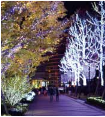
▲徳島文理大学 【場所】山城町西浜傍示 【点灯時間】12月3日(木)～平成28年2月14日(日)17時～21時