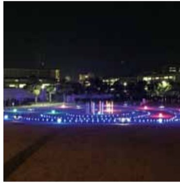
▲徳島大学 【場所】南常三島1 【点灯時間】12月11日(金)～平成28年1月19日(火)17時30分～23時