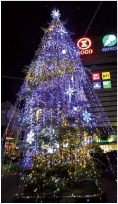
▶とくしま駅前広場ガーデンスリー 【場所】徳島駅前広場 【点灯時間】平成28年2月14日(日)まで17時～22時 ※12月19日(土)～25日(金)は24時まで

徳島市内には、LEDを効果的に取り入れた公園やモニュメント、街並みが数多くあります。12月は、趣向を凝らした色鮮やかなイルミネーションがさまざまな場所で点灯する時季。水都・とくしまの夜をLEDの光が幻想的に彩っています。皆さんも足を運んでみませんか。