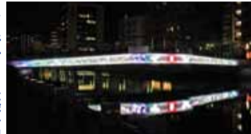
▲新町川水際公園周辺 【場所】南内町2・3丁目 【点灯時間】日没～22時(一年中) ※12月21日(月)～25日(金)は24時まで