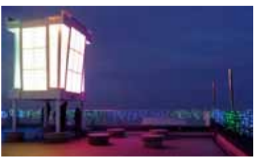
▲LED万華鏡モニュメント「眉華鏡」

★クリスマスLEDイルミネーション 【とくしま】12月25日(金)まで17時～21時 【とくしま】12月19日(土)～24日(木)17時30分～21時 ☆眉山ロープウェイ夜間運転 ※大人往復610円。悪天候の場合は運転を中止することがあります