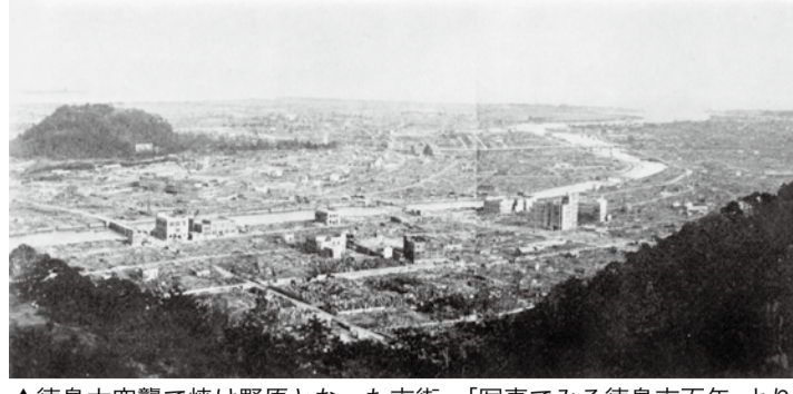
▲徳島大空襲で焼け野原となった市街

平成27年は、先の大戦が終わってから70年となる節目の年です。この大戦により、多くの尊い命が犠牲となり、徳島市でも昭和20年7月4日未明の大空襲により、死者約1000人、負傷者約2000人、被災者約7万人の被害を受け、旧徳島市内の約6割は焼失しました。