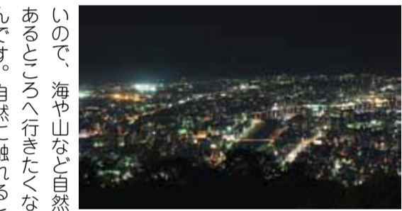
▲眉山山頂から見た市内の夜景

ちと行ったり。路上で踊り も好きでよく見ました。 市長 徳島といえば、自然と阿波おどりという感じが すが、食べ物で好きなものは何がありますか？ 市長 そば米汁が好きです。東京ではあまり知らない人が多いです。あんなにおいしいの。あとは、徳島ラーメンやお好み焼きも好きです。東京の食べ物とはまた違うなと思います。徳島に帰ってきたら行く店が何軒かあります。 市長 共済者に徳島について聞かれます。 市長 よく聞かれます。なかなか行くことがないみたいで、「徳島って何があるの」って聞かれます。 市長 徳島はもともと認知度を上げていかないとね。阿波おどりは知ってても徳島を知らなかったり。 市長 いいところいっぱいあるんですけどね。 市長 徳島市には、「トクシイ」というイメージがあるんですけどね。 市長 徳島市には、「トクシイ」というイメージがあるんですけどね。