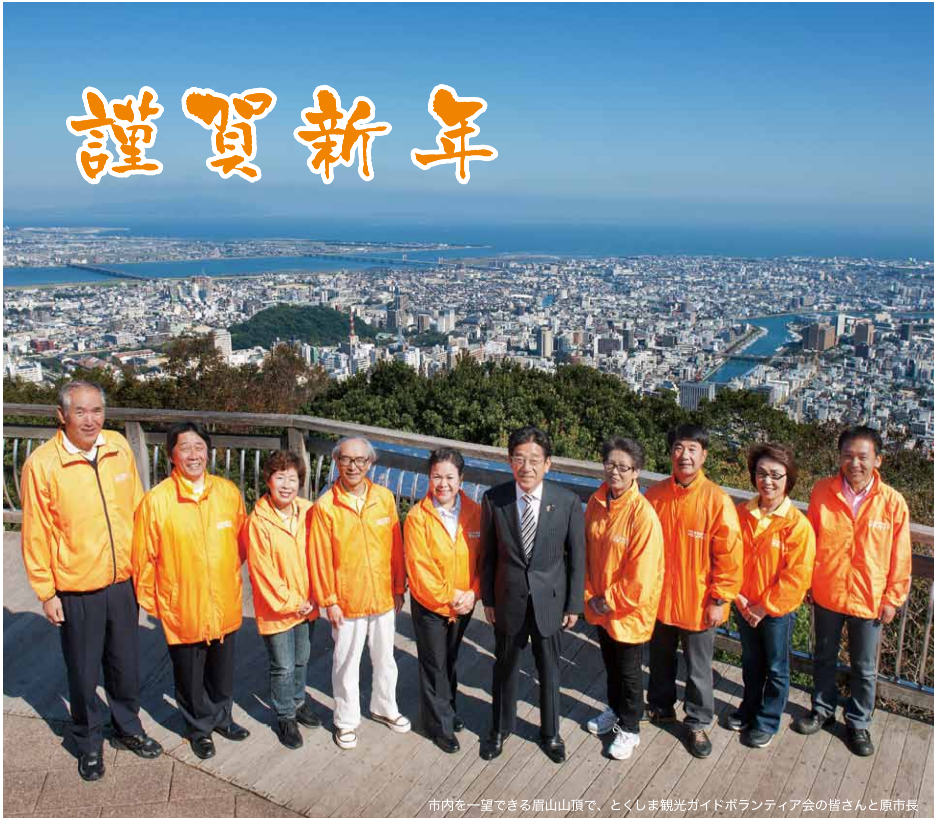
市内を一望できる眉山山頂で、とくしま観光ガイドボランティア会の皆さんと原市長