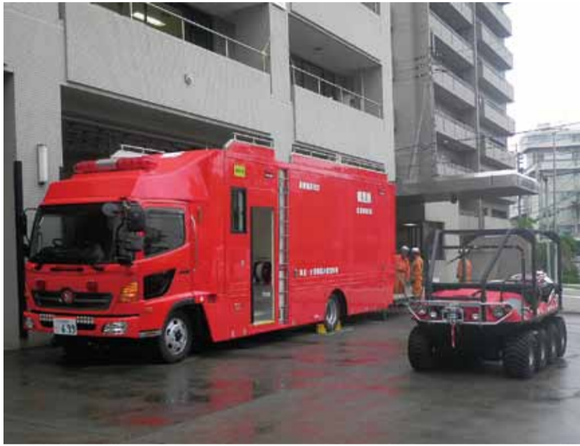
▲津波・大規模風水害対策車(左)と搭載されているバギー(右)

このたび、緊急消防援助隊の機動力を強化するため「津波・大規模風水害対策車」が、消防庁から徳島市消防局に無償貸与されました。対策車は、東日本大震災での救助活動の経験から新たに開発した車両で、全国で15台配備されました。四国では初めての配備となります。