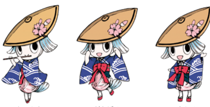
しのぶえ がんばる てをふる