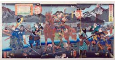
▲月岡芳年「桶狭間大合戦之図」

江戸・明治の人々の幻想の中を縦横無尽に駆け巡る多くの英雄たち。今回の企画展では、そうした英雄たちの姿を描いた浮世絵をそろえました。彼らの勇姿をどうぞご覧ください。