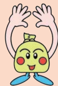
▲徳島市のごみ減量マスコットキャラクター「ごみゼロん！」