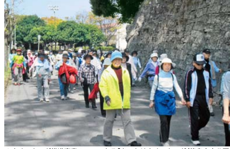
▲ウォーキング推進事業の一つである「きっかけウォーキング(徳島中央公園コース)」に参加する市民の皆さん

計画策定にあたり、平成23年度に実施した市民意識調査の結果からは、平成16年度の調査結果に比べ、食生活について問題があると感じている人が増えているなど、食生活や運動に関する市民の意識の向上や知識の普及が見受けられました。その反面、家事や仕事以外に1日30分以上歩いている人の割合が減っていることなどから、自らの生活習慣の改善に向けて行動するには至っていないと推測されます。