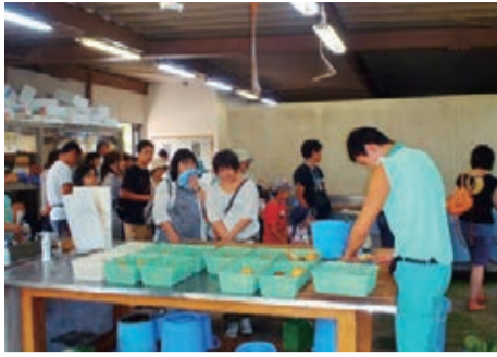
▲昨年行われたバックヤードツアーの様子

【内容】▼学芸員とともに長寿動物の寝室などを回るバックヤードツアーの実施(定員10組※参加希望の人は13時までに入場券を申し込みください)。参加希望者多数の場合は当日抽選します(参加者にはオリジナルグッズをプレゼントします)▼65歳以上の人は入園無料(免許証や保険証など年齢を証明する