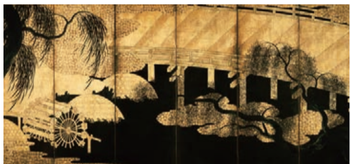
▲「柳橋水車図屏風」県指定文化財