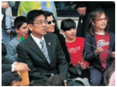
▲レイリア第6小学校での歓迎式典に参加する市長

で徳島市ふるさと応援寄附金として3万円以上を寄附していただいた人※寄附の申し込みだけでは対象となりません。7月15日（水）までに手続きを完了された人が対象です。 招待日時 8月12日（水）15日（土）のうち1日。公演時間は第一部（18時～20時）・第二部（20時30分～22時30分）のいずれか 招待演舞場 市役所前、藍場浜、紺屋町、南内町のいずれかの有料演舞場 注意事項 寄附金のお振り込みをいただいた順に席をお取りし