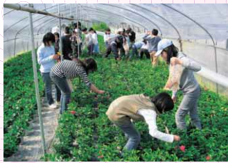
▲昨年の農業体験めぐりに参加した子どもたち

【申し込み方法】往復はがきに住所、名前、学校名と学年、電話番号、返信あて名を書いて、2月27日(金)までに徳島市農業士会(〒770-8571 幸町2-5 農林水産課内 ☎621-5252)へ。徳島市ホームページ「電子申請」からも申し込み可。