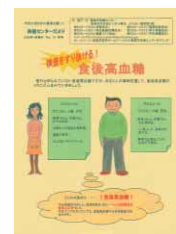
健康センターだより冬号