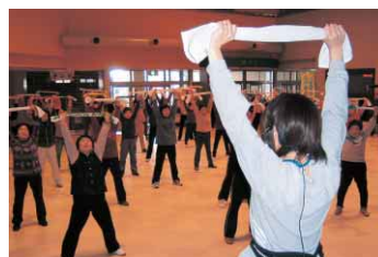
きっかけ体操の様子