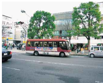
▶日曜市直通便もある「ぐるぐるバス」 紺屋町日曜市会場前