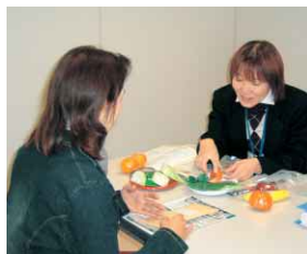
健康についてご相談ください

医師・保健師・栄養士・健康運動実践指導者が健康相談を行っています。健診結果の見方や気になることがあればいつでもご相談ください。