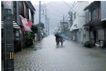
平成16年台風23号による冠水の様子(市内)