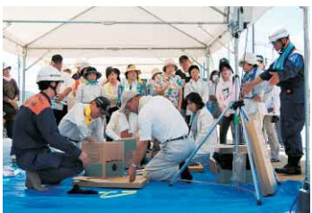
7月に実施された徳島市民総合防災訓練(勝占地区)

現在、市内には5066の組織があり、4万2223世帯の皆さんが加入していますが、結成率は、37・91%という状況です(平成20年8月15日現在)。