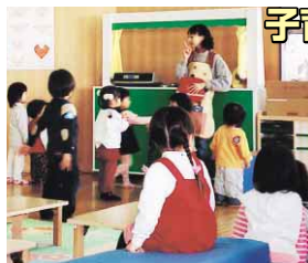
団員の話熱心に聞く子どもたち

徳島市では、保育士などの資格を持つ人や子育て経験豊富な市民ボランティアを「子育て応援・支援団員」として登録し、地域の児童館や子育てサークルなどの依頼を受けて派遣しており、現在、この「子育て応援・支援団員」への新規登録者を募集しています。