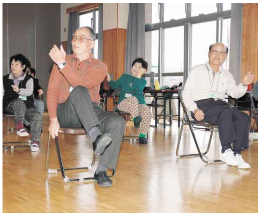
筋力づくりのために、体操をする皆さん (南井上地区で行われている「元気高齢者づくり事業」)

●徳島市の広報番組 「マイシティとくしま」(四国放送テレビ) 毎週日曜日 11:50~正午放送 「こんには徳島市です」(ケーブルテレビ徳島) 毎日4回巡回わりて放送