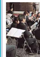
徳島市サクラだより