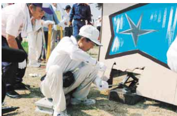
倒壊した家屋からの救出方法などを学ぶ地域の皆さん(昨年)

多くの尊い命と貴重な財産を一瞬のうちに奪った阪神・淡路大震災から、まもなく11年。わたしたちはこの震災で、自らの命を守ることがや住民同士の助け合いの大切さ、また、ボランティアの力の大きさを学びました。1月15日～21日は「防災とボランティア週間」です。大切な命や財産を災害から守るためにできる助け合いやボランティアについて、いま一度考えてみましょう。