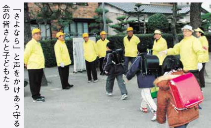
「さよなら」と声をかけあう守る命の番のたより

●徳島市の広報番組 「マイシティとくしま」(四国放送テレビ) 毎週日曜日 11:50~正午放送 「こんには徳島市です」(ケーブルテレビ徳島) 毎日4回週替わりで放送