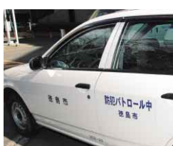
車の両側にステッカーを取り付けた公用車

U字になった先端と長い柄が特徴の「さすまた」は、距離を保ちながら、相手の動きを止める用具です。