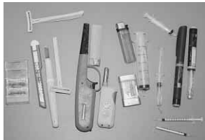
プラスチック製容器包装の中に入っていた異物

プラスチック製容器包装ごみは、いろいろな製品の原料として利用できる貴重な資源です。しかし、注射器やライター、カミソリ、割れたガラスのような、危険な物を混入すると、リサイクルやごみ処理に支障があるだけでなく、作業員が怪我をするおそれがあるため、十分に分別してください。