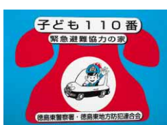
徳島東警察署管轄内の子ども110番の家に貼られたステッカー

「子ども110番の家」は、子どもたちが不審者に会ったときに、助けを求める地域の民家や商店などで、市内に約1600カ所の登録があります。