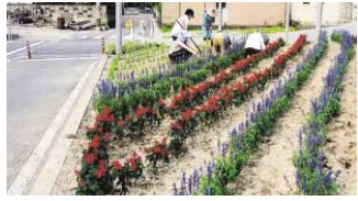
▲市の助成による花苗で彩られた一宮町内の花壇と、手入れをする地域の皆さん

【助成対象】花苗・苗木・種子・球根・プランターなど。ただし、一定以上の植栽面積・本数が必要です。※なお、詳細については直接、公園緑地課にお問い合わせください。 【申請方法など】位置図、詳細図、土地管理者の承諾書、団体の会則、会員名簿などを添えて直接、徳島市役所4階・公園緑地課(〒770-8571 幸町2丁目5)へ。 【問い合わせ先】公園緑地課(621)52995