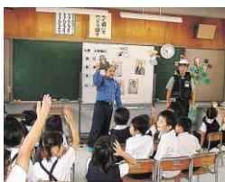
市内の小中学校で行われた防犯教室の様子

児童生徒が危険を回避する能力を身につける安全教育を推進しています。警察などの協力により、防犯教室の実施や不審者等からの避難訓練などに取り組んでいるところで、これらを取り戻し実施するよう計画しています。