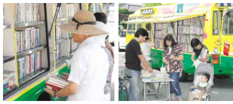
多くの利用者でにぎわう「いずみ号」