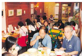
市民の人たちとの交流の場として、イラスト展なども開催し、開設2周年を迎える「街の中の喫茶店」

害者も人や街の中に出て互いに知り合うことが必要だ、と、同10年、障害者が集い、働く小規模通所授産施設としての手作り弁当の製造販売店を北島田町に開設、喫茶店はこれに継ぐ施設で、営業時間は月・木・金曜日の11時から14時まで。