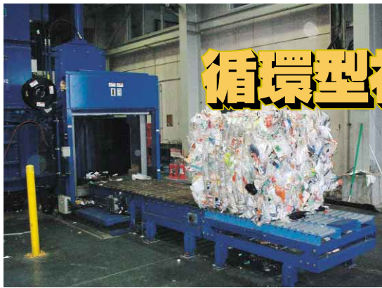
■プラスチック製容器包装処理施設 16年10月からの分別収集により、1,691tのごみをリサイクルできました。これからは、過剰包装のものを避けるなどの工夫もしていきましょう。

4月から橋廃棄物最終処分場に搬出 徳島市が、焼却したごみや廃プラスチックなどを埋め立てていた沖洲廃棄物最終処分場は、3月末で満杯になりました。 平成19年の春に徳島東部臨海処分場(松茂町)ができるまでの2年間のごみの行き場が懸念されてきました。この受け入れについて県や阿南市との協議が整い、4月から搬出が始まっています。これにより県外搬出は避けられました。増加する運送費などの経費は数億円