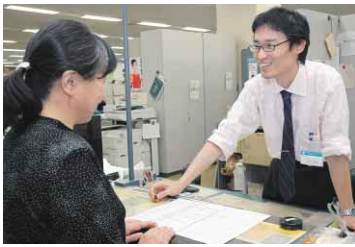
笑顔の応対で親しみやすい市役所づくりに努めます。

設的なご意見や提言も、私へのメールや、市民ボストなどを通じて、ぜひお寄せください。