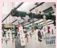
さまざまな形や色合いが楽しめる風鈴ギャラリー=昨年の様子

【送先・問い合わせ先】眉山ロープウェイ(新町橋2丁目20 阿波おどりで会館3階 ☎652-3617) または観光課 ☎621-5231