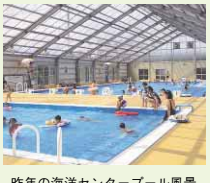
昨年の海洋センタープール風景

【営業期間】6月15日(水)~9月15日(水) 10:00~17:00 【入場料】高校生以上230円、小・中学生110円、3歳~幼児50円(いずれも30人以上は団体割引あり)。小学3年生以下は保護者同伴のこと。※障害者手帳持参の障害者と、その介助者(1人)は無料です。 【問い合わせ先】B & G海洋センタープール ☎663-3633