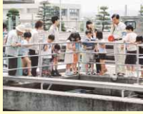
きれいな水にする「ろ過池」見学

【とき】6月5日(日) 10:00~15:00 (小雨決行) 【ところ】第十浄水場(名西郡石井町藍畑字第十) 【内容】施設見学、水道相談コーナー、実験コーナー(ペットボトルの簡易浄水器)、工作コーナー(水道パイプで水鉄砲作り)など 【問い合わせ先】水道局 ☎623-1187