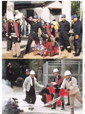
市長も参加した佐古地区での自主防災訓練の様子（昨年11月）

そのためには、名前だけでなく実のある自主防災会をつくるために、できるだけ町内会の集まりがあると出掛けていって、「皆さん組織をつくって助け合います。よろしくお願いします」と呼びかけています。