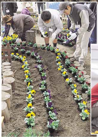
NPO法人徳島共生塾一步会が開いた子どもボランティア体験講座で、昭和コミュニティガーデンの花植え作業。