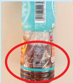
中身が入ったもの