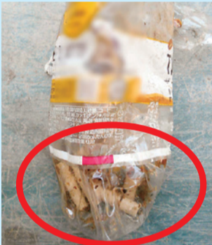
異物(たばこなど)が入ったもの