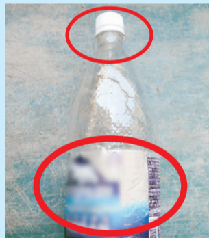
キャップやラベルが外されていないもの