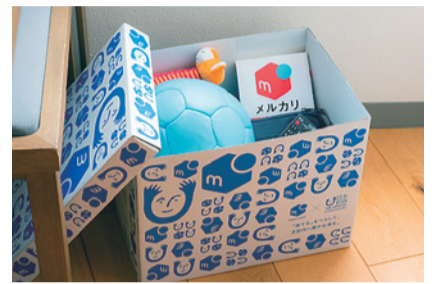
▲メルカリエコボックス