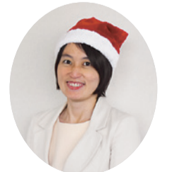
徳島市長 内藤 佐和子

メニュー上で、子育てやイベント情報など、さまざまなジャンルの中から希望する情報だけを受け取ったり、タブを切り替えることで、より多くの情報を素早く入手できるようになっています。今まで以上に便利になった「徳島市公式 LINE」をぜひご活用ください。