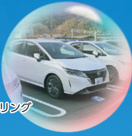
公用車シェアリングの実証実験