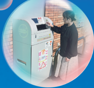
公民連携で一部のコンビニにペットボトル専用回収機を設置