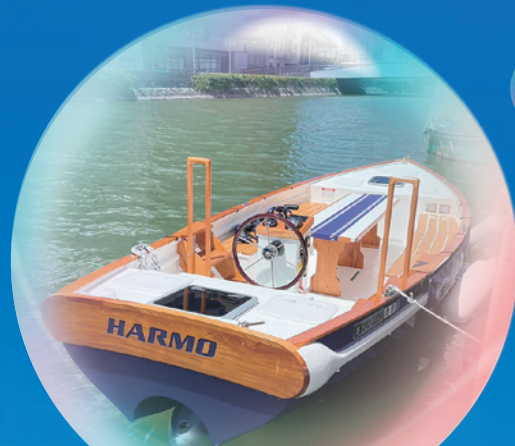
ひょうたん島周遊船の電動化に向けて電動船「HARMO」を運航

令和5年10月1日現在(前月比) 人口/247,285人(-192) 男/117,711人(-102) 女/129,574人(-90) 世帯数/122,257世帯(-27) 面積/191.52km 2