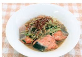
▲鮭ともやしの簡単レンチン蒸し