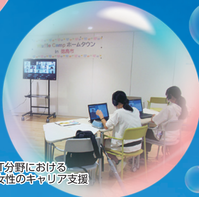
IT分野における女性のキャリア支援