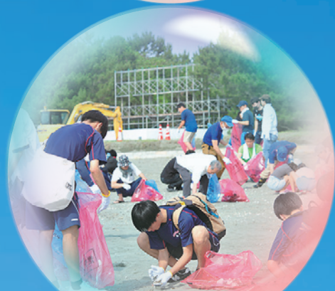
小松海岸クリーン大作戦

徳島市はSDGs(持続可能な開発目標)の実現に向けて積極的に取り組む都市として、令和4年5月に国から「SDGs未来都市」に選定されました。現在、「ダイバーシティ(多様性)」と「パートナーシップ(公民連携)」を掲げ、さまざまな取組を進めていますが、SDGsは、市民と民間事業者の皆さんが一緒になって、社会課題の解決に取り組むことが何よりも重要です。