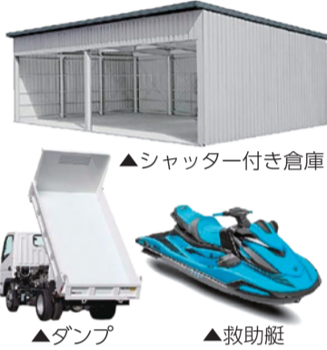
▲シャッター付き倉庫

本市では、B&G財団(*)の「防災拠点の設置および災害時相互支援体制構築事業」の支援金を活用し、とくしま動物園北島建設の森にシャッター付き倉庫や油圧ショベル、ダンプ、避難所運営に必要な機材などを配備した防災拠点の整備を進めています。また、消防局には、救助艇(水上バイク)を配備しました。