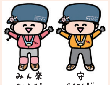
▲防災サポーター PRキャラクター

徳島市では、「徳島市総合計画2021」に掲げる基本目標「強靱で未来へと続く！安心あふれるまち『とくしま』の創造」の実現に向け、さらなる防災対策に取り組み、誰もが安全・安心に暮らせるまちを目指します。詳しくはお問い合わせください。