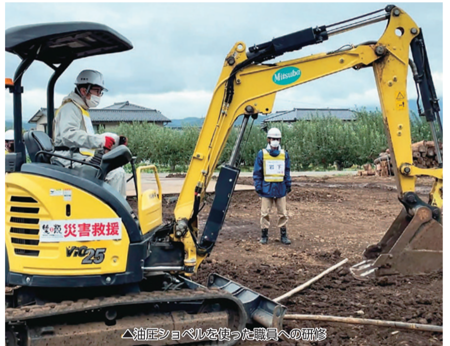
▲油圧ショベルを使った職員への研修