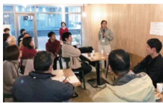
▲移住者交流会の様子