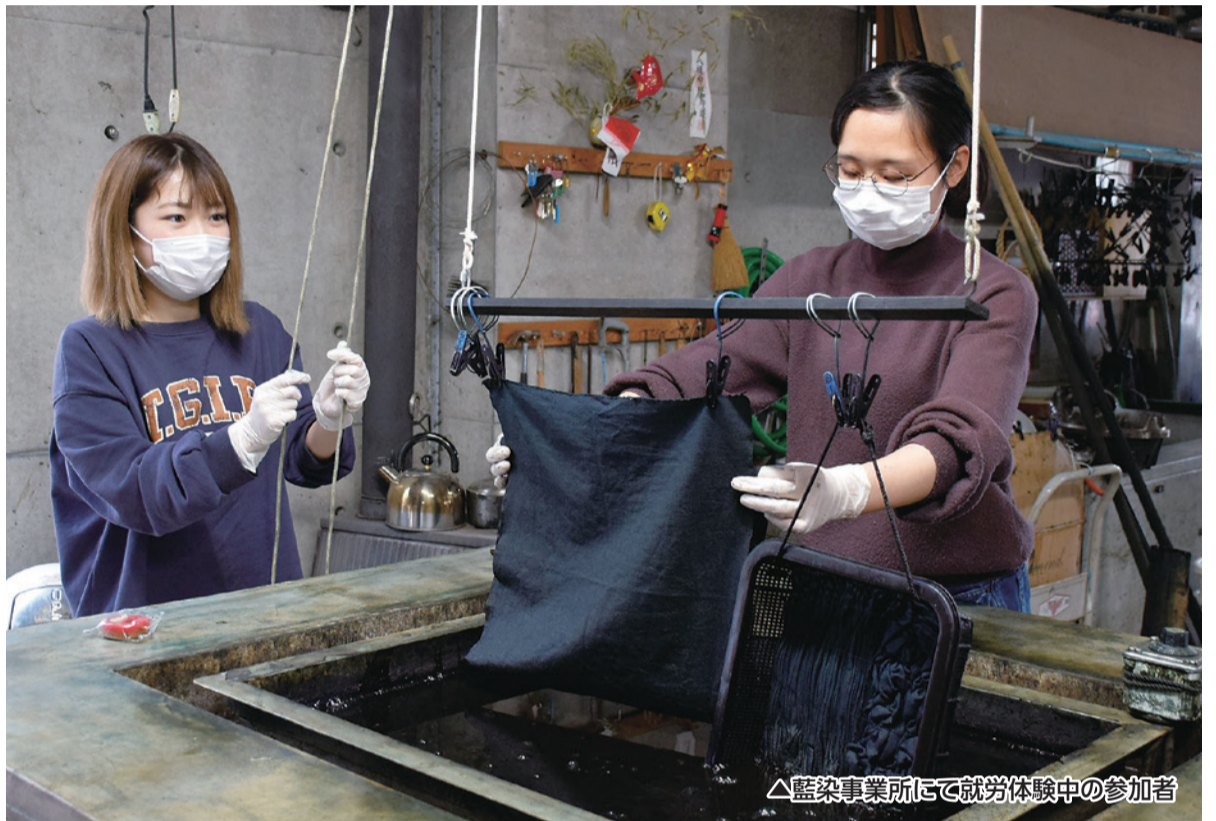
△藍染事業所で就労体験中の参加者