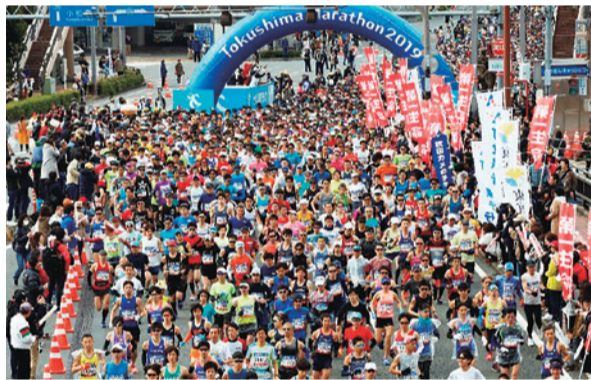
▲「とくしまマラソン2019」スタート時の様子

【問い合わせ先】 とくしまマラソン実行委員会事務局(☎621-2150)、文化スポーツ振興課(☎621-5426 FAX624-1281)