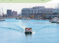
▲ひょうたん島クルーズ