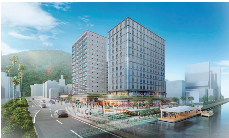
▲新町西地区市街地再開発事業の完成イメージ

徳島市では、徳島市中心市街地活性化基本計画に基づき、活力とにぎわいあふれるまちに向けた取り組みを進めています。今号では、新町西地区市街地再開発事業の事業計画変更を認可したことを踏まえ、同事業についてご紹介します。