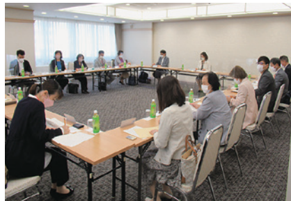
▲徳島市男女共同参画推進ネットワーク会議の様子

こうしたことから、市域全体で男女共同参画に関する取り組みを推進するため、令和3年11月に横断的組織として、大学、経済団体、市民団体などの多種多様な団体で構成する「徳島市男女共同参画推進ネットワーク会議」を設置しました。