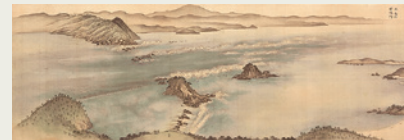
▲鳴門十二勝真景図巻

開館30周年記念展の第一弾として、徳島藩と蜂須賀家に関わる美術工芸資料を紹介する企画展を開催。県指定文化財の「鳴門十二勝真景図巻」や「熊笹蒔絵鞍籠」をはじめとする名品