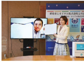
▲連携協定締結式の様子

市役所本庁舎などの女性用トイレや多目的トイレの個室に配布機器を設置します。利用者は専用のスマホアプリをかざすことで、生理用ナプキン1枚を無料で受け取ることができます。※生理用品の購入費は、配布機器のディスプレイで流れる広告料で賄います。