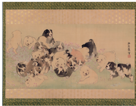
▲長澤芦雪筆「狗子図」個人蔵

過去から現在へと受け継がれ、伝わる文化財の中には、贈り物としての役割を果たしてきた品々が見受けられます。同企画展では、徳島藩主蜂須賀家から人々へ贈られた品物にまつわるヒストリーをご紹介します。