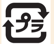
▲プラマークごみの識別マーク