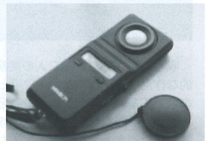
明るさは照度計で測定します