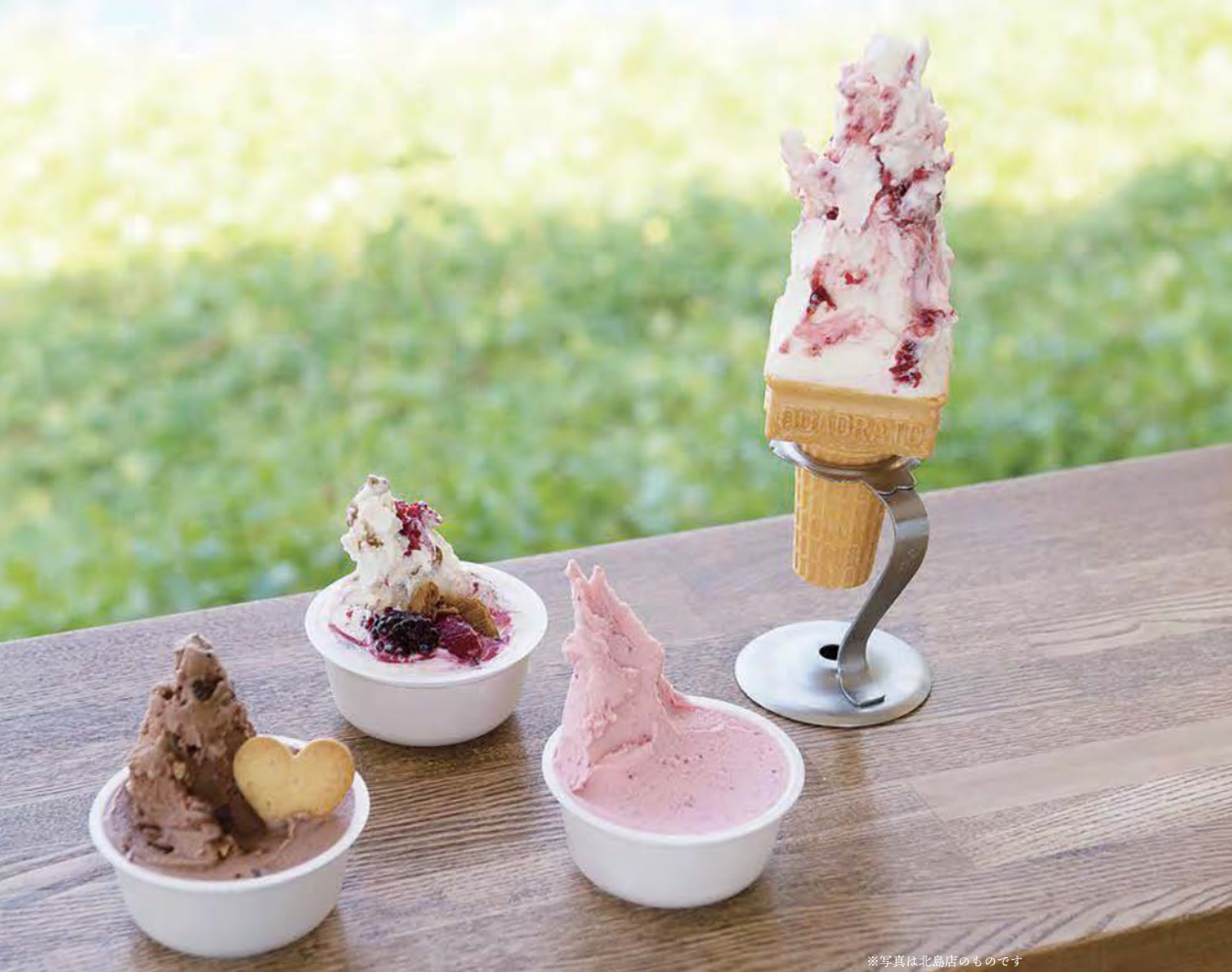
※写真は北島店のものです