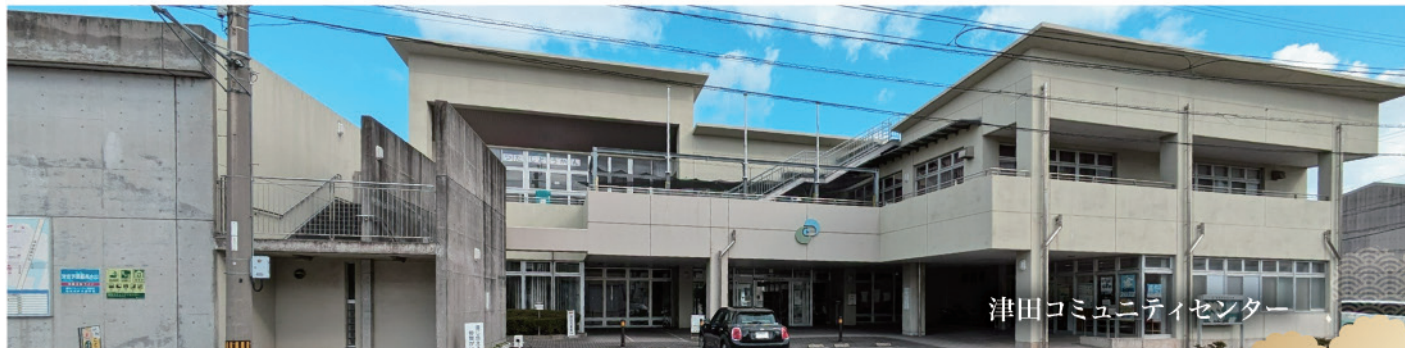
津田コミュニティセンター