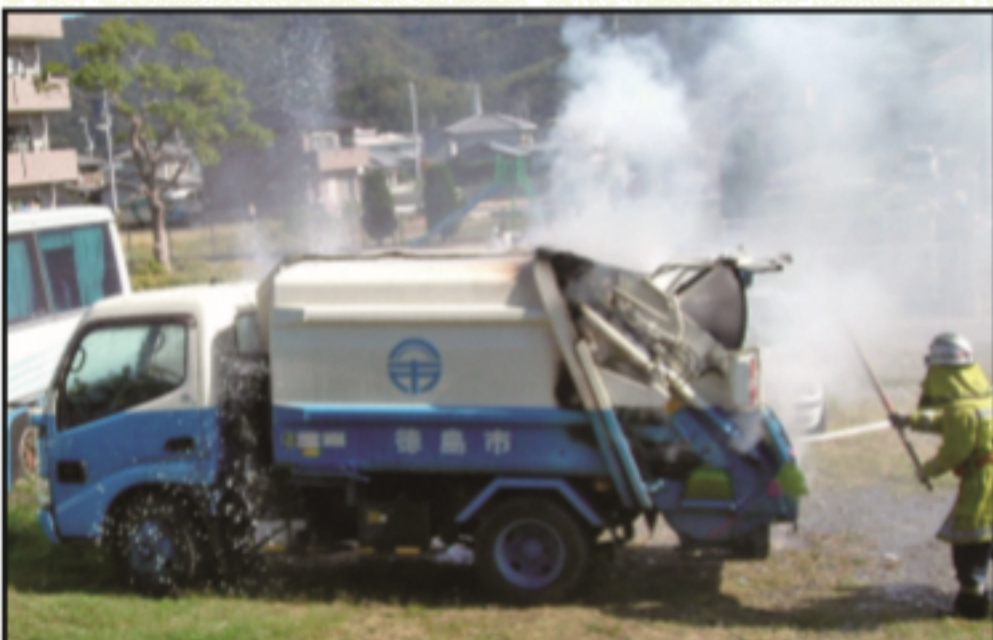
ごみ収集車の火災が発生し、消火活動を行っている様子

車両火災の原因は、スプレー缶・カ セットボンベ、ライターが大多数を占 めています。