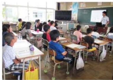
出前ごみスクールの様子

徳島市職員が各学校に出向き、ごみの授業をする出前ごみスクールや、ごみ処理施設見学会も随時受付していますので、お問い合わせください。