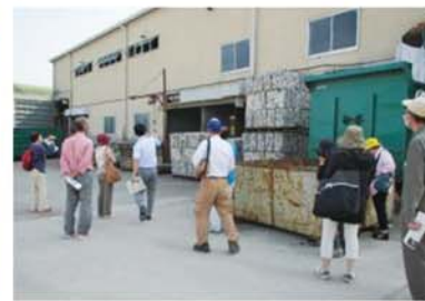
ごみ処理施設見学会の様子