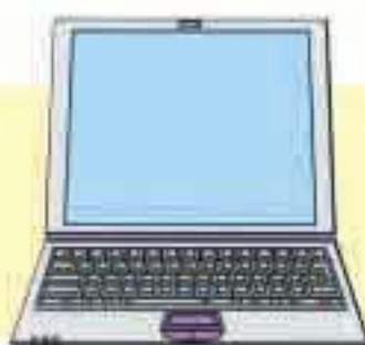
ノートブックパソコン