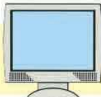
液晶ディスプレイ (一体型を含む)