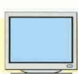
ブラウン管ディスプレイ (一体型を含む)

※ご購入時の標準添付品(マウス、キーボード、スピーカー、ケーブル等)も一緒に回収します。