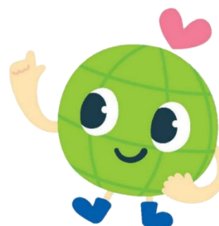
徳島市エコオフィスプランマスコットキャラクター 「TEOP(テオップ)」