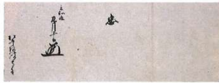
徳川秀忠一字書出／徳川秀忠官途書出