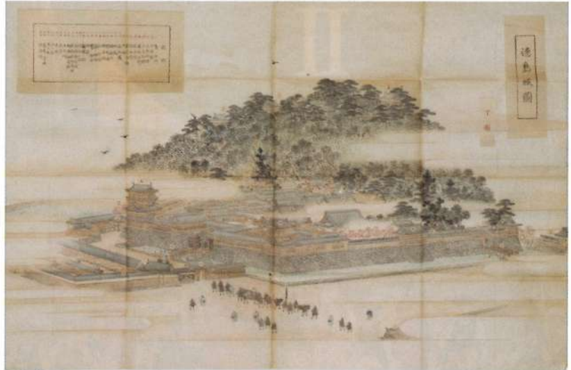
徳島城図 須木一胤筆 (蜂須賀正子氏寄贈)