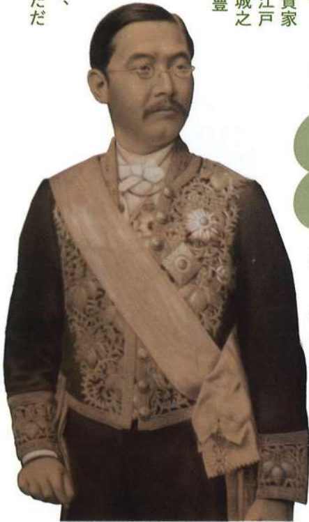
蜂須賀茂詔肖像 (蜂須賀正子氏寄贈)