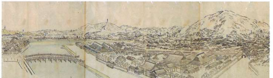
御山下眺望之図(部分)