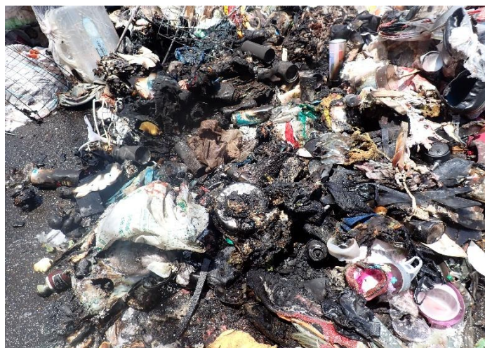
令和8年5月14日(水)に多家良町で発生した火災