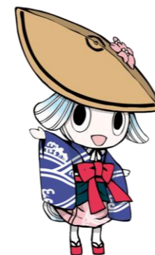
徳島市イメージアップキャラクター「トクシィ」

電話通訳コールセンター Multi-language call center 多国语言翻译呼叫中心 다국어콜센터 Centro de atendimento multilingue Centro de llamadas multilingüe